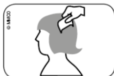
Abb. Durchkämmen des nassen Haars mit Läusekamm vom Haaransatz bis zu den Haarspitzen